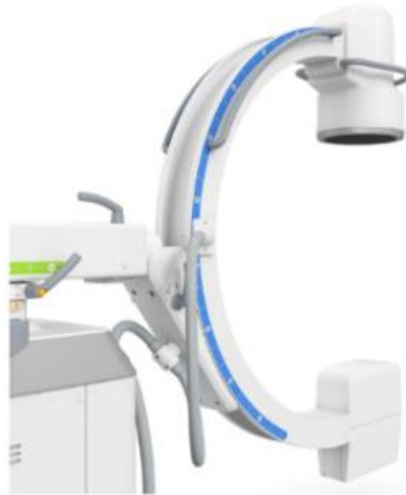
Figura 3: Arco em C