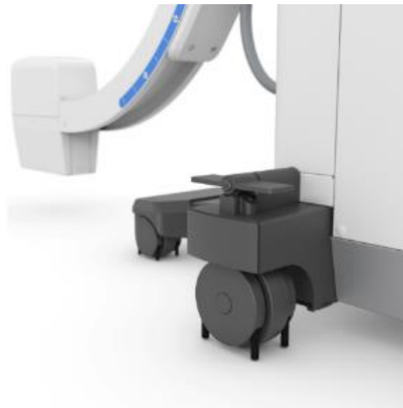
Figura 2: Gerador de Raios-X