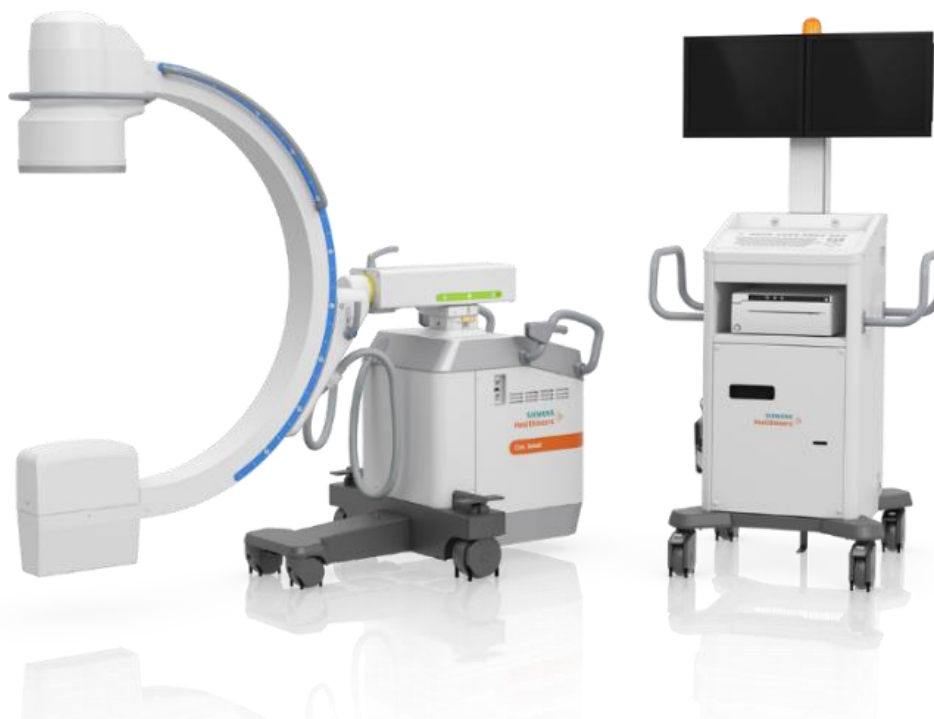
Figura 1: Cios Select

Composto por Arco-C montado sobre rodízios, Gerador de Raio X, Tubo de Raio X, Colimador, Unidade de comando, Intensificador de imagem e Sistema de TV com suporte móvel, com subtração digital de imagens.